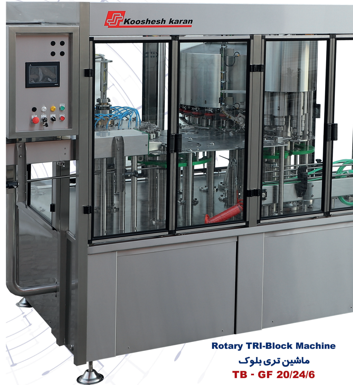
Rotary TRI-Block Machine